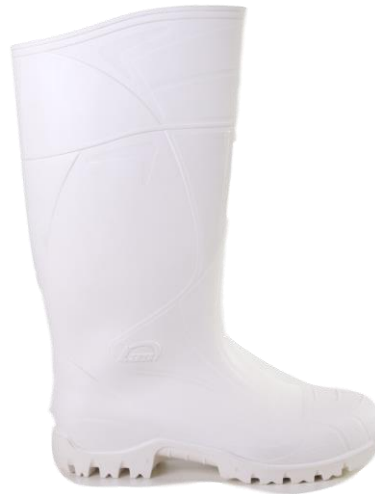
Foto lateral del calzado